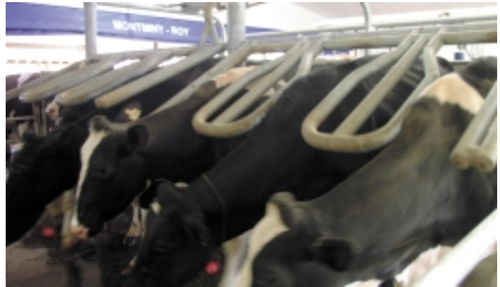
Con el botón ALL EXIT puede liberar todas las vacas al mismo tiempo

Desde 2x3 Centro a centro: 27" (68.6 cm)